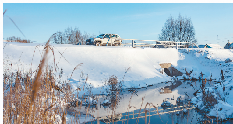
Обновленный мост в Зай-Каратае является важным транспортным звеном села